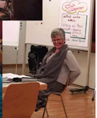
Impressionen vom Infotag